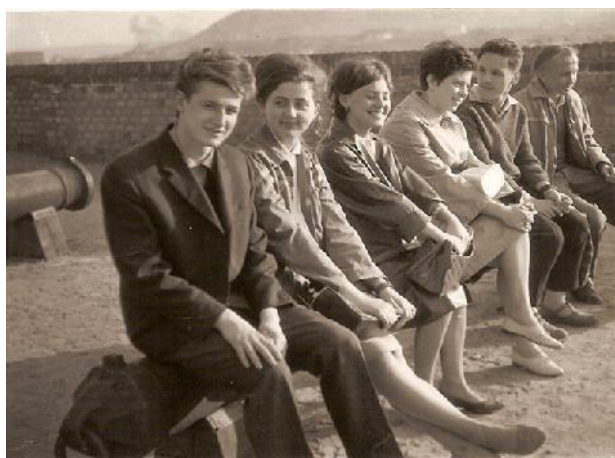
A Hadtörténeti Múzeum előtt -1964. ősz