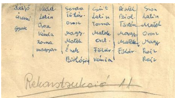
Valaki egykori órarendje