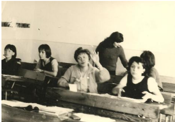
Az utolsó padsorok