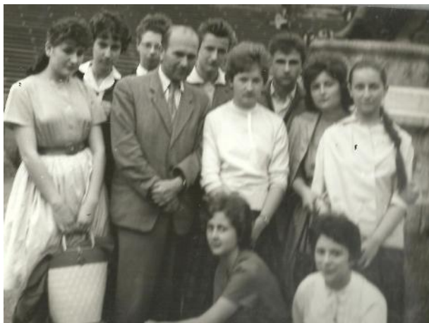
A Nemzeti Múzeum előtt - 1962.(?) tavasz

A Tas tanár úr által vezetett történelem szakkör keretében gyakran látogattunk meg a témához kapcsolódó intézményeket.