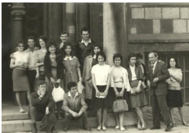
1963. tavaszán ellátogattunk az Országos Levéltárba