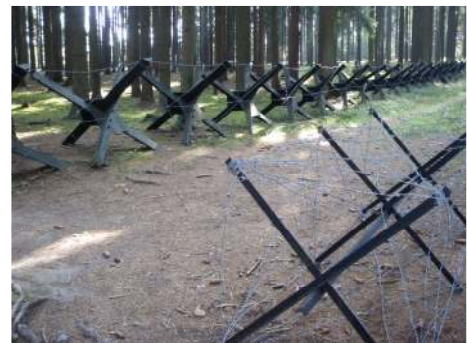
A vasfüggöny emléke

Az ebédet követő rövid szieszta után floorballozni mentünk, ahol a Euro Teens csapatai és a helyiek megküzdöttek egymással. Ezek után lezuhanyoztunk, és igyekeztünk vacsorázni. A vacsora után elmentünk tekézni, ahol 3 diák- és egy tanárcsapat küzdött a győzelemért. A győztes csapat a tanároké volt. Mi a második helyezést értük el. A játék után elmentünk a szállásunkra, és egy jót aludtunk ez után a kimerítő nap után.