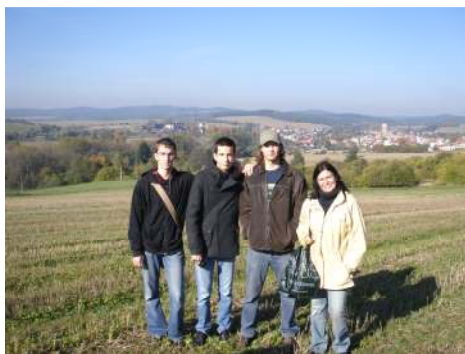
Geodéziailag a legbiztonságosabb terület a Földön

Ez a vidék geológiailag a világ legbiztonságosabb területe. Tettünk egy sétát a település körül, miközben egy domb tetejéről teljes rálátást kaptunk erre a mesés falura.