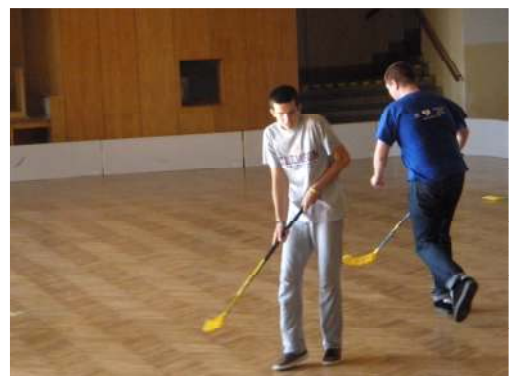
Ádám mindent megtett a győzelem érdekében

Az ebédet követő rövid szieszta után floorballozni mentünk, ahol a Euro Teens csapatai és a helyiek megküzdöttek egymással. Ezek után lezuhanyoztunk, és igyekeztünk vacsorázni. A vacsora után elmentünk tekézni, ahol 3 diák- és egy tanárcsapat küzdött a győzelemért. A győztes csapat a tanároké volt. Mi a második helyezést értük el. A játék után elmentünk a szállásunkra, és egy jót aludtunk ez után a kimerítő nap után.